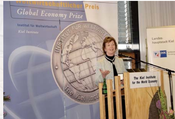
Mary Robinson, ehem. Staatspräsidentin der Republik Irland (Preisträgerin 2009)

Festredner: Bundespräsident Prof. Dr. Horst Köhler